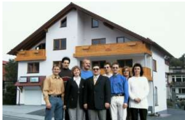
Promax Deutschland und Service Center Ihrig beschäftigten zusammen 9 Mitarbeiter

Da im Wohnhaus in Winterkasten keine weiteren Räumlichkeiten zur Verfügung standen, wurde zunächst der Werkstattbereich bei der Firma König angemietet. Nach Fertigstellung des neuen Gebäudes 1999 zogen Promax Deutschland und Service Center Ihrig unter das gleiche Dach.